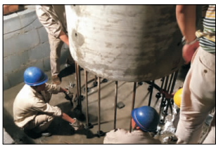
图2 上海国定路下匝道墩柱插槽式连接

围推广装配式桥梁施工,该桥预制构件包含除承台以外的所有上、下部结构及防撞墙,并研发了盖梁横向分段预制,构件间采用灌浆套筒连接,预制装配率达到30%。