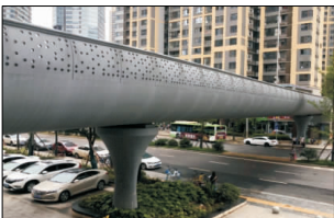
图 5 长沙北辰彩虹桥

与长沙市相似,成都市装配式市政桥梁建设同样起步晚,起点高,发展速度快。2017 年开工建设的羊犀立交改造工程主要包括增建羊犀立交节点 SE、EN、NW、NE、WS、ES、JS 7 条匝道及对辅道出入口进行改造和优化,其 111 根墩柱均采用预制,且创新地采用花瓶墩,墩柱与承台采用灌浆套筒连接,同时取消盖梁,结构更美观(见图 6)。其总工期仅 345d。这是中国西南高地震烈度地区全装配式