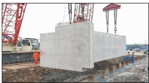
(a) 预制桥台插槽式连接