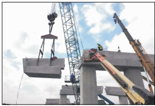
(b) 预制盖梁牛腿式拼接