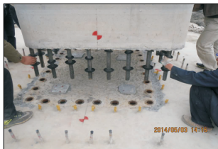
图1 上海S6公路四标段试验段预制桥墩