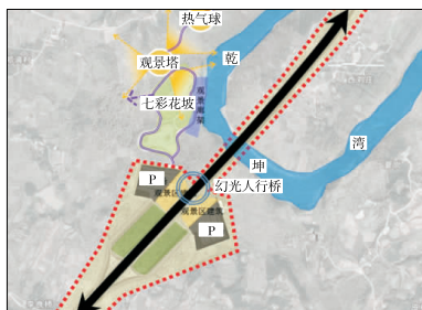
图4 淮河乾坤湾观景停车区平面图

“最后一公里”问题。通过设置人行天桥,满足游客两侧通行,为南湾湖景区西大门输送游客,为景区创造门前区,发挥高速公路的通景功能。功能分区主要设置停车区、简单的休憩设施,如凉亭、信息解说板、垃圾桶等。通过设置一定的观光辅道,实现高速公路与普通公路的共同停车区,该处亦可作为游客观光游览区域及当地百姓的游乐场所。景观标志有人行天桥,可营造为花藤桥或茶仙子桥(见图5)。