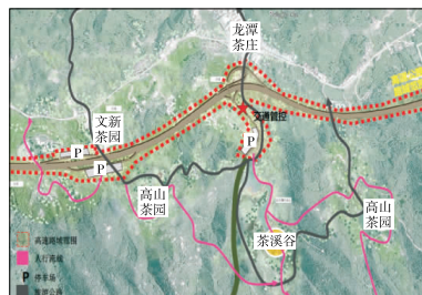
图7 龙潭文新观景停车区平面图

(4) K54+650 龙潭文新观景停车区。龙潭文新观景停车区位于淝河港乡南侧,文新茶厂体验区和龙潭茶叶市场之间。停车区与文新茶园结合起来共同打造,充分利用高速公路的客源优势,打造以品茶、茶叶采摘、制作观赏等独具特色的茶文化体验区。重点解决高速公路发展与当地特色产业、乡村旅游共融发展的的问题。以赏茶、品茶、摘茶、做茶等活动为主题,形成高速公路沿线连通辅道在内的高山湖畔茶叶观光公园,串成一条有序的旅游环线。规划功能区有观光环线、观光车站、茶叶体验观光旅游区(高山茶园、滨湖茶园、峡谷茶园、茶庄、茶社)、名山景观段、茶叶主题精品路线(见图7)。