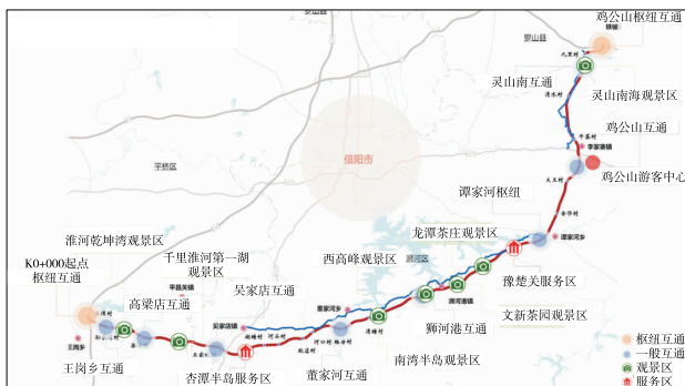
图 1 明鸡高速公路交旅融合方案

该项目设置 10 处互通立交、2 处服务区、7 处观景游憩区、1 处游客中心,以观景游憩区和服务区为主打造旅游核心景区。全线分为 3 个主题段落,分别为千里淮河风情段、南湾茶海风情段、信阳名山风情段。项目定位为中国第一条高速公路旅游风景道,高速公路交旅融合的全新标杆,道路、文化、旅游、产业、生态融合发展的新范式,围绕明鸡高速公路形成综合产业带、乡村振兴带、旅游休闲带与美丽风景带,打造主题为绿慢静雅——山水楚韵、茗香豫道,建设“交通+文化+旅游+产业”融合示范基地,建造中国最美旅游高速公路风景道(见图 1)。