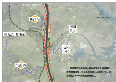
图6 西高峰观景停车区平面图

(3) K49+580 西高峰观景停车区。西高峰观景停车区位于淝河港乡北侧,南湾湖西侧的湖畔观景区域,设置高处山峰观景,游客通过该停车区可登高望远,尽收南湾湖的美景。重点解决高速公路发展与当地特色小镇、乡村振兴之间的关系,实现“湖、茶、镇”的协同发展。规划功能区主要设置停车区、简单的休憩设施,如凉亭、信息解说板、垃圾桶等。通过设置一定的观光辅道,为淝河港特色小镇的发展创造动力。高速公路右侧可设置观景阁,实现登高远眺(见图6)。